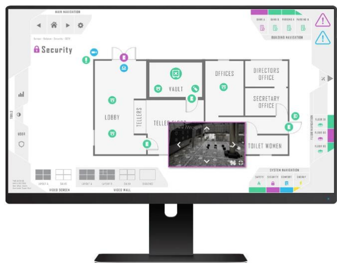
Sky walker bms software